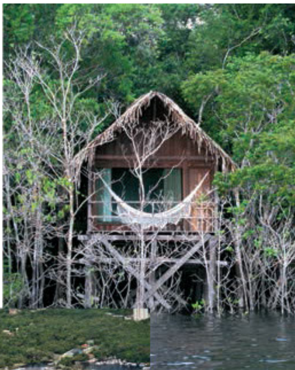
Muitos projetos de ecoturismo na Amazônia têm permitido uma melhoria da qualidade de vida das populações locais

minoso e bonito é um verdadeiro hotel flutuante que permite aos clientes, que por diversas razões não gostam de pernoitar em plena selva, visitar a Amazônia, com todo o conforto, segurança e luxo.