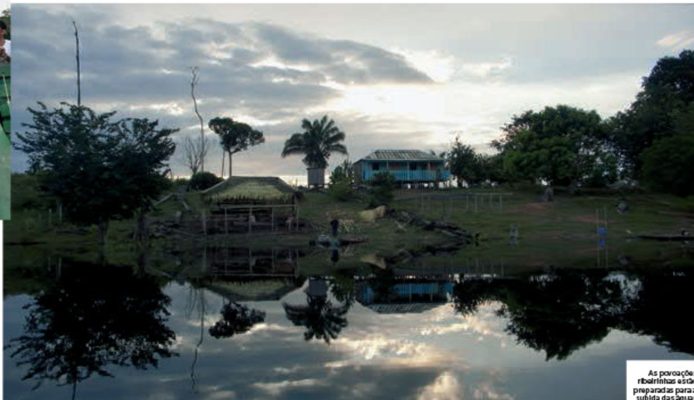
As povoações ribeirinhas estão preparadas para a subida das águas