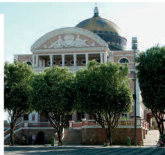
A vida em Manaus é dominada pela Ópera e o vibrante dos barcos galota

A cidade voltou a surpreender-me pela sua desordem e múltiplos contrastes, sobretudo junto à zona histórica: velhos palacetes do século XIX, com arquitectura de inspiração europeia, ruas e passeios de calçada à portuguesa, avenidas a fervilhar de gente e um trânsito caótico. É perante esta desordem placidamente instalada que abandono, disposta a palmilhar os lugares mais emblemáticos da cidade.